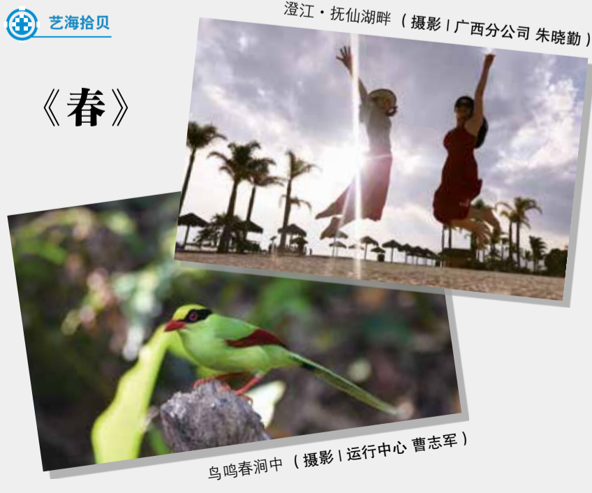
澄江·抚仙湖畔